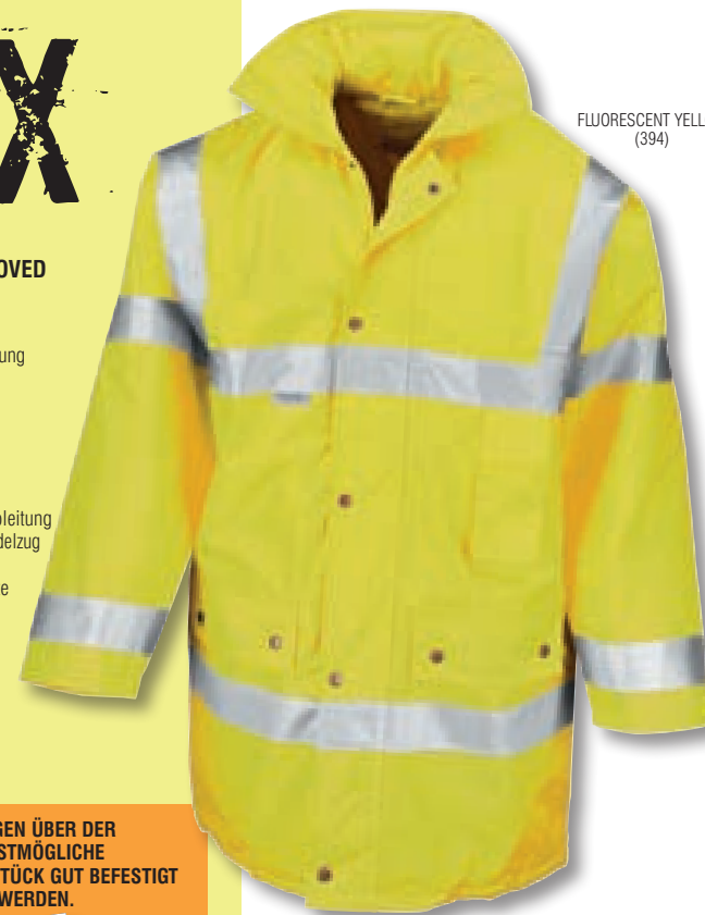
FLUORESCENT YELLOW (394)

LÄSSIGER SCHNITT FÜR BEQUEMES TRAGEN ÜBER DER TAGESBEKLEIDUNG. HINWEIS: FÜR GRÖSSTMÖGLICHE SICHERHEIT SOLLTE DIESES KLEIDUNGSSTÜCK GUT BEFESTIGT UND IN SAUBEREM ZUSTAND GETRAGEN WERDEN.