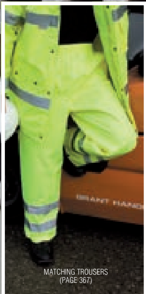
MATCHING TROUSERS (PAGE 367)