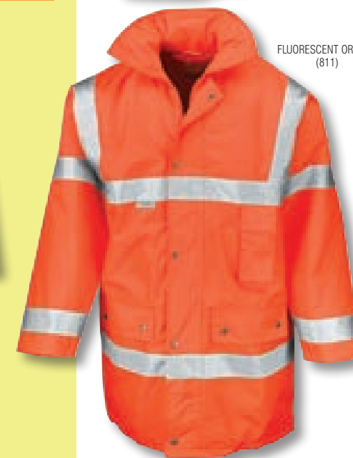
FLUORESCENT ORANGE (811)