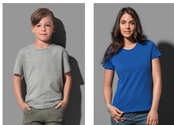
ST2220 Classic-T Organic Kids